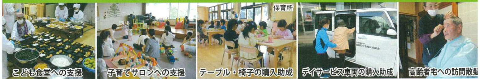
こども食堂への支援