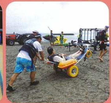
障がい児者チャレンジ事業