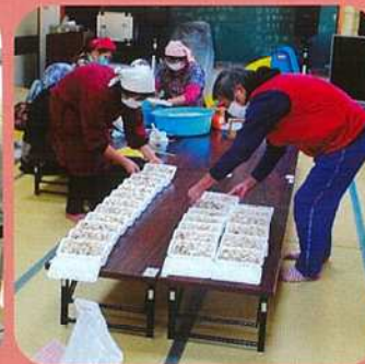
高齢者宅へのお弁当配布